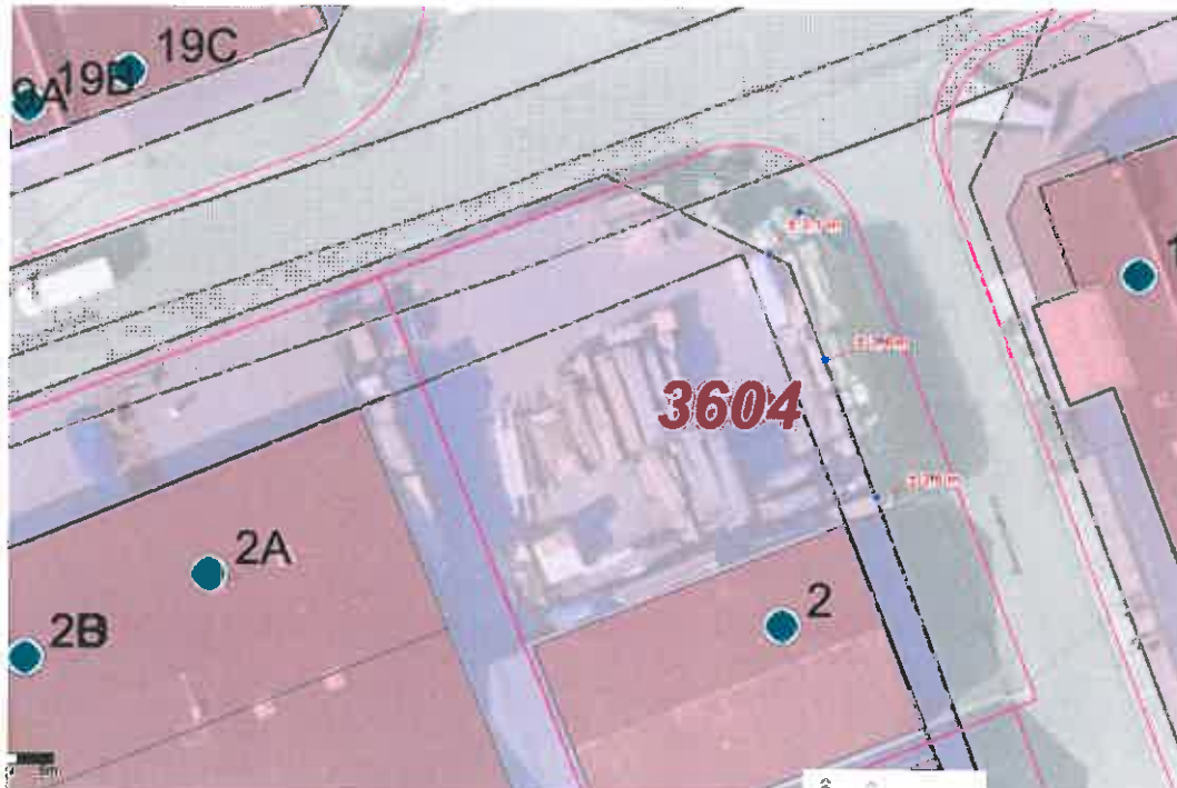
Afbeelding 01: luchtfoto van de bedrijfslocatie Constructieweg 2 in Nieuwkoop voorzien van een transparante laag met de bestemmingen. Grijs = verkeersbestemming, (Licht) paars is de bestemming Bedrijventerrein. Zichtbaar is dat een deel van de bedrijfsopslag binnen de verkeersbestemming is gesitueerd.

* ook bouwwerken, geen gebouw zijnde, worden als bebouwing aangemerkt