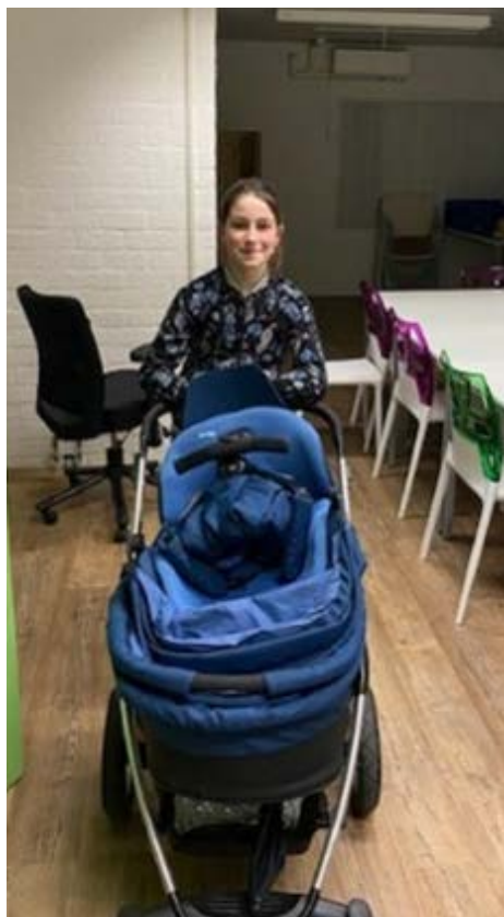
Blij met mooie wandelwagen voor haar kleine nichtje.

Ook Etos hield een inzamelingsactie en Hema hielp met beddengoed. Comforta bood schoenen aan en allerlei bedrijven hebben zich aangemeld voor werk. TradeFrm uit Nieuwveen levert gebruikte fietsen voor vluchtelingen. Maar ook scholen, serviceclubs zoals Rotary en Lions bieden diensten en goederen aan.