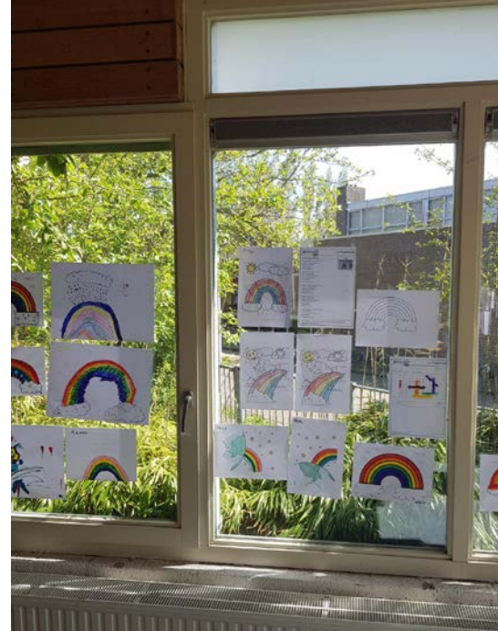
Regenboogtekeningen van de schooljeugd.