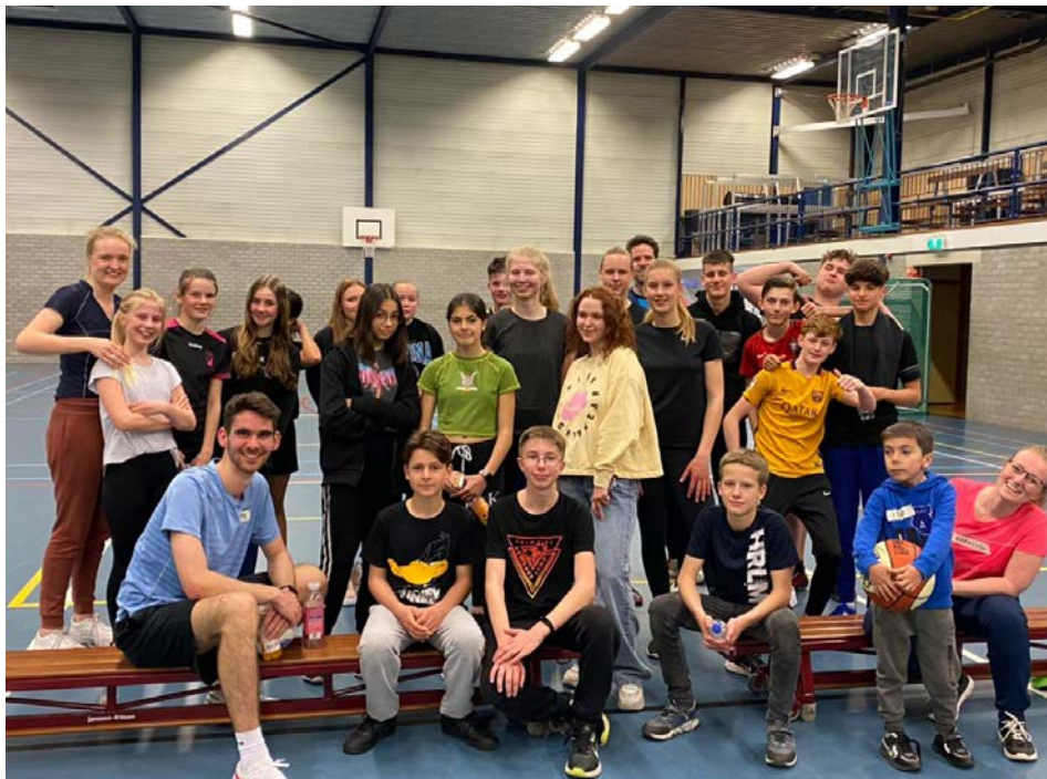
Oekraïense jeugd en jongeren van Evangelische Gemeente De Brug tijdens een sportieve 'Alive' bijeenkomst in De Steupel.